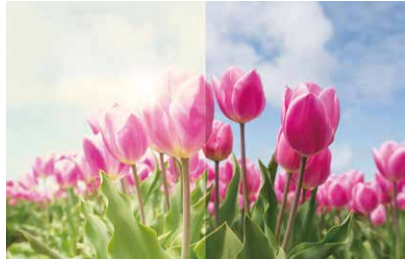
有效滤除部分黄光, 让色彩更鲜明